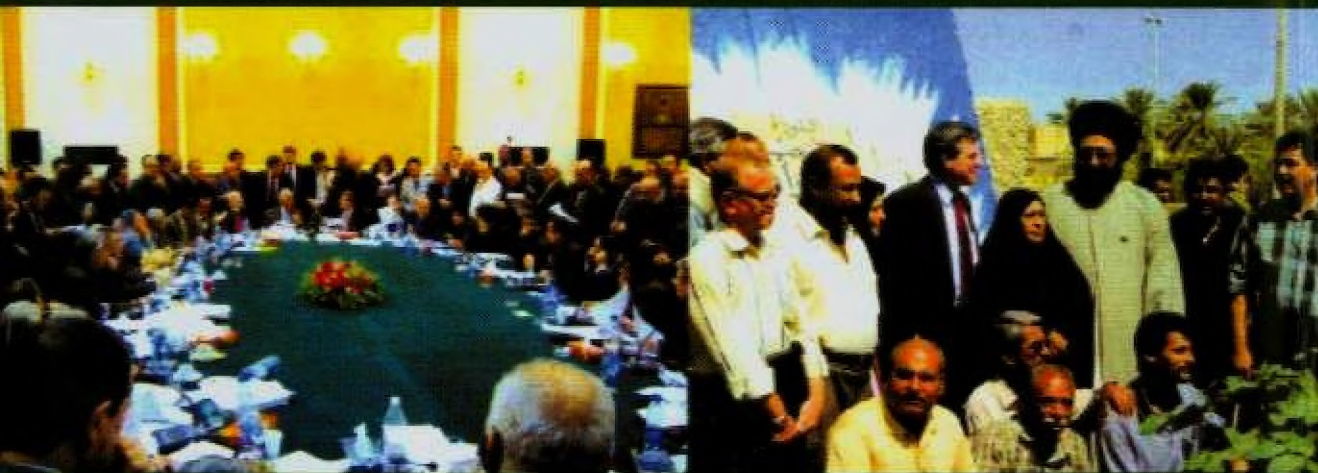
عند نُصَّب ضحايا صدام في الحلة